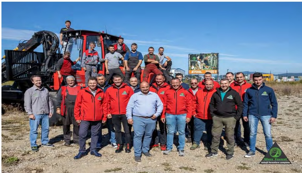
Echipa de agenți de vânzări teritorială – la Ședința în Septembrie 2021