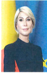
MINISTRUL CULTURII RALUCA TURCAN